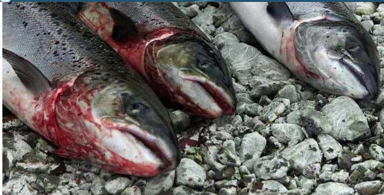
Syk laks.