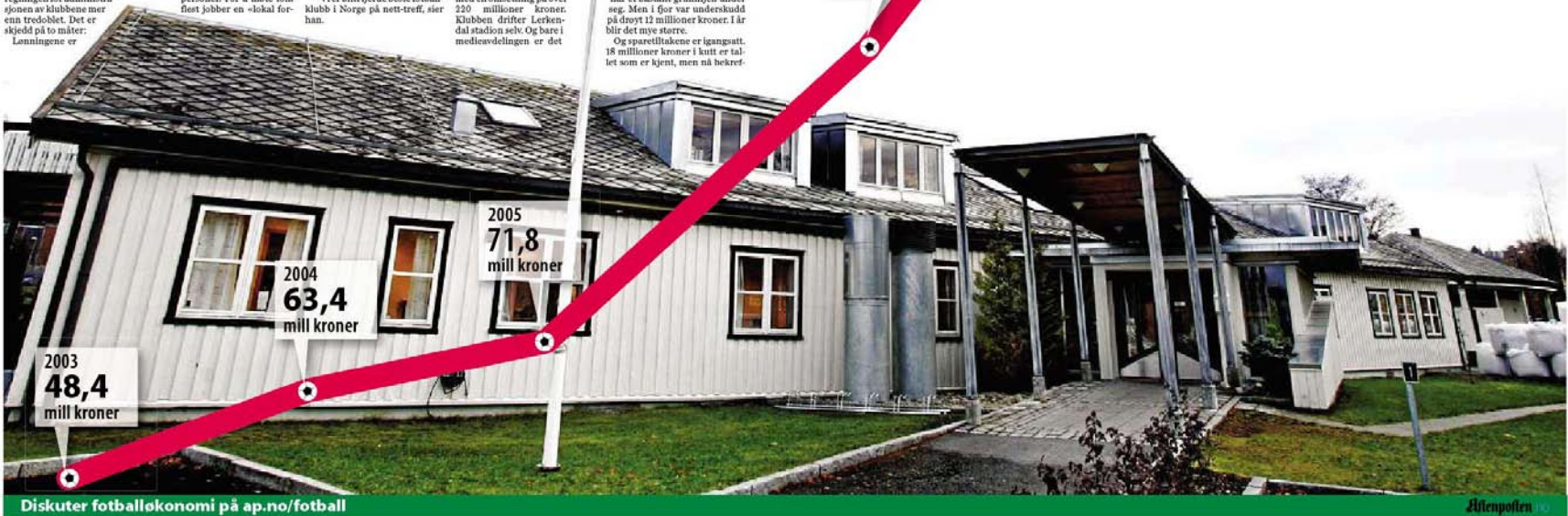
Diskuter fotballøkonomi på ap.no/fotball