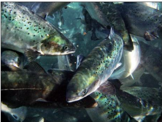
TRUET: Oppdrettsnæringa trues av lakselus.

Omfanget av lakselus er tredoblet i oppdrettsanleggene i høst. Forskerne frykter at næringa går på en katastrofe og legges brakk.