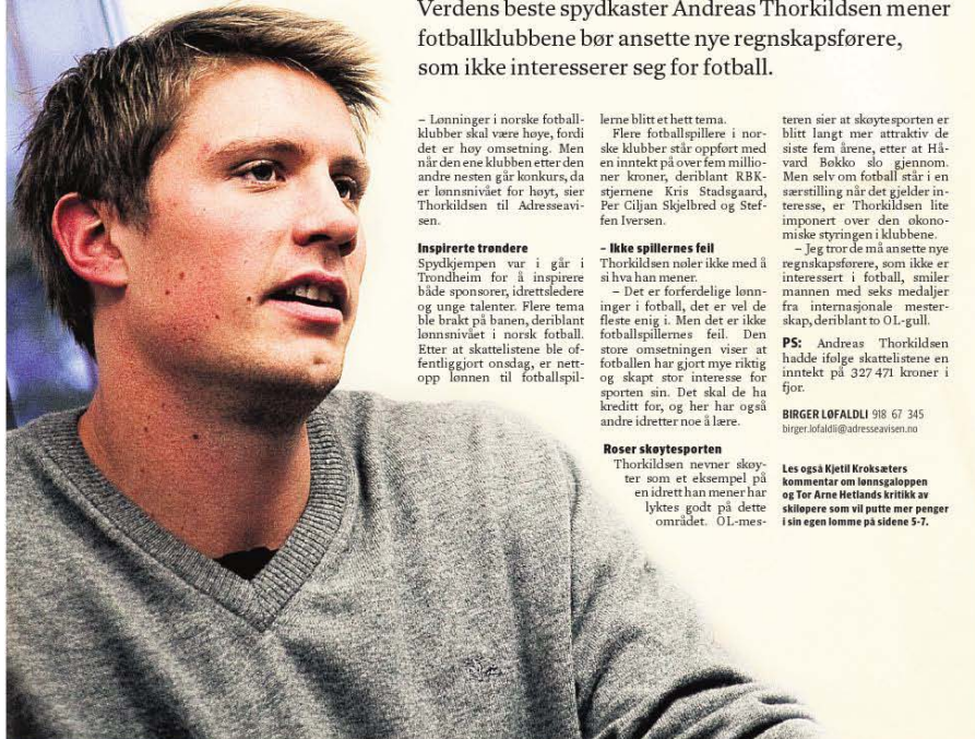
Refs fra gullguttene