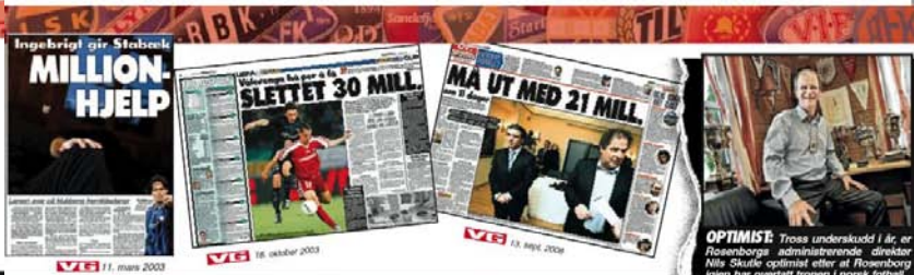
VG 11. mars 2003

- Toppklubbene blir alltid reddet i siste øyeblikk