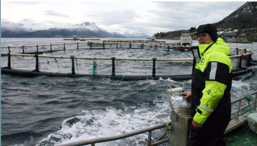
FARE: Laks som rømmer fra oppdrettsanlegg er en økonomisk trussel, mener Naturvernforbundet.

Naturvernforbundet mener Giske må rydde opp.